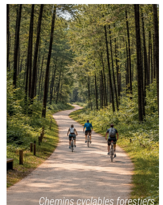
Chemins cyclables forestiers