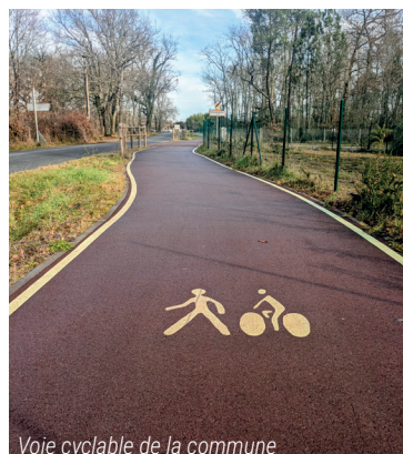
Voie cyclable de la commune

Ces liaisons prolongeront ce qui a été initié, afin que, demain, traverser la commune à pied ou à vélo devienne une évidence et non plus une contrainte.