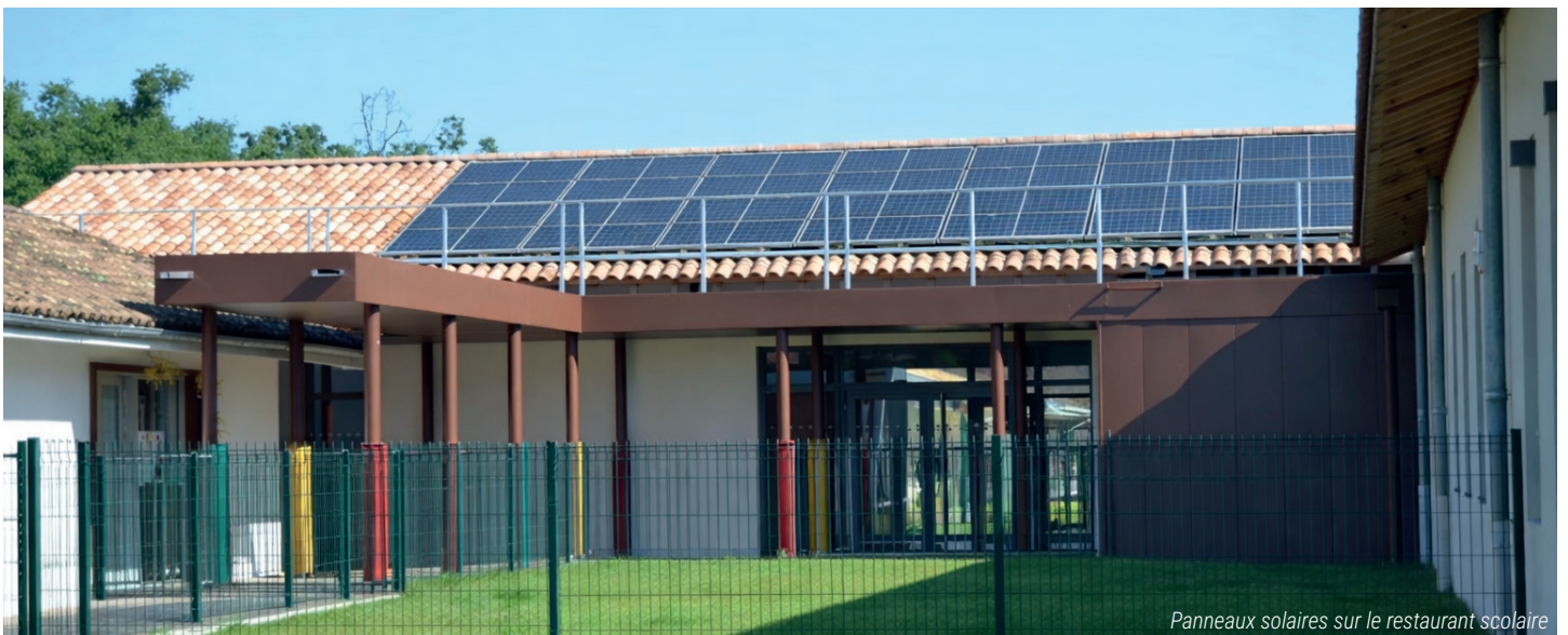
Panneaux solaires sur le restaurant scolaire

Le Pian-Médoc doit rester un endroit où l'on se sent en sécurité, partout, tout le temps.