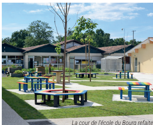
La cour de l'école du Bourg refaite

Le Conseil Communal des Jeunes sera repensé pour y intégrer les adolescents et un budget participatif leur sera confié, avec comme premier projet de repenser la zone du skate-park de la Lande de Josta. À cet âge, proposer, créer, décider change tout : on se sent utile, légitime, acteur de sa commune.